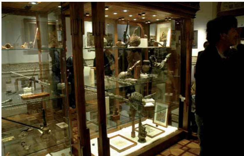
Algunos de los 6.500 objetos que se exhiben en las numerosas vitrinas del museo.

El pasado 9 de mayo, dos días antes de su inauguración oficial, el flamante nuevo Hemp Museum Gallery de Barcelona acogió la celebración de la gala de entrega de los Premios de la Cultura del Cannabis 2012. Desde media tarde, buena parte de la escena cannábica catalana, junto a periodistas, cámaras, fotógrafos y curiosos se fueron congregando a las puertas del Palau Mornau, a la espera de que llegaran los premiados.